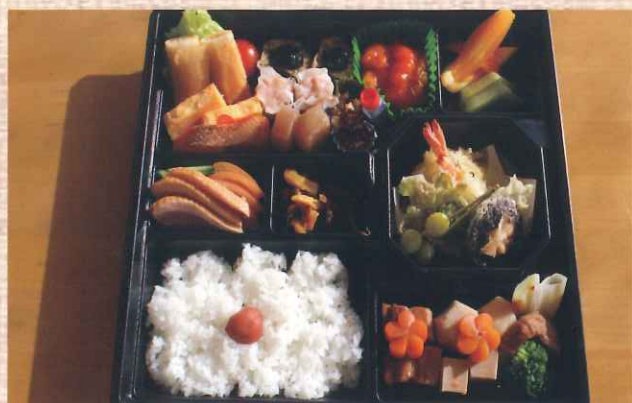
幕ノ内弁当 税込 1100 円