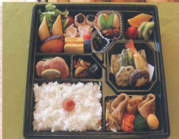
旬彩弁当 税込 1500 円