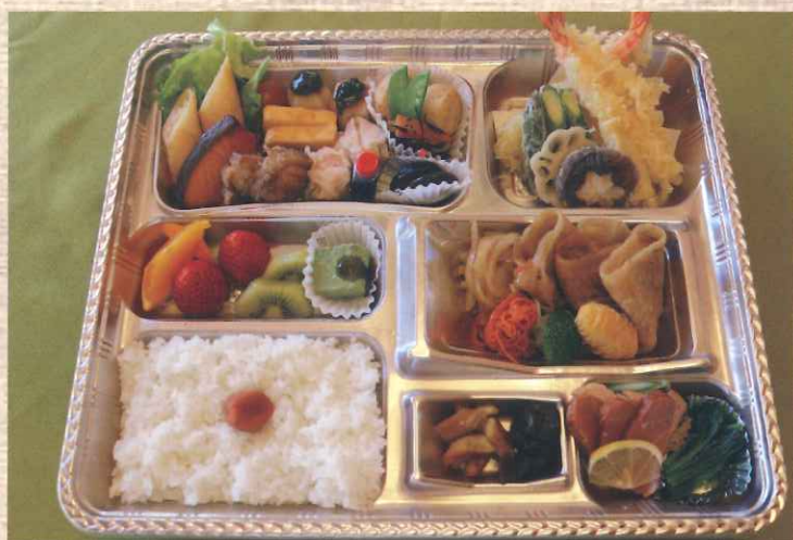
彩弁当 税込 2000 円