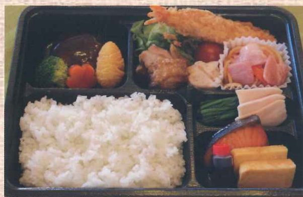
お子様弁当 税込 600 円