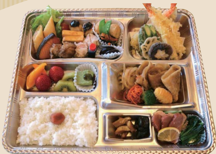
彩弁当 2000円 税込