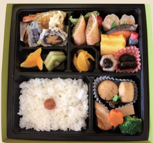
幕ノ内弁当 1100円 税込