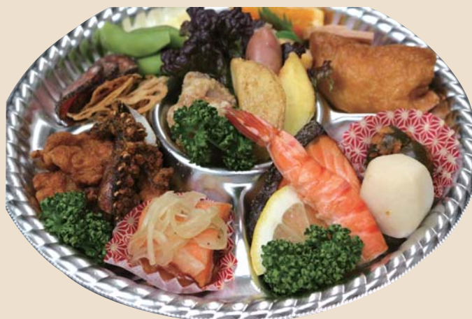
オードブル(1人前) 1500円～ 税込 予算に応じてお作りします