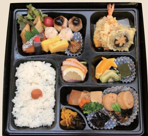
旬彩弁当 1500円 税込