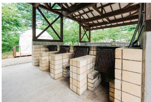
■ 炊事棟・かまど（ご利用可）