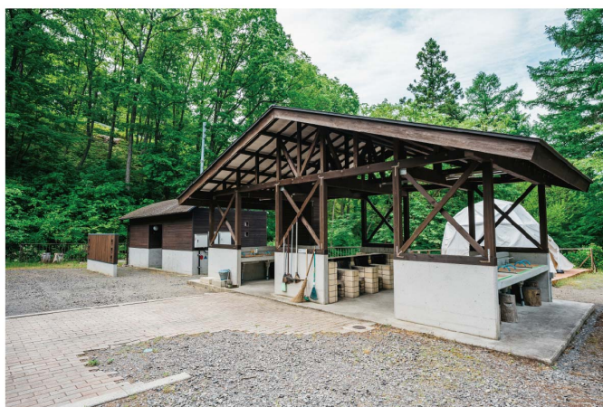
■ 隣接の炊事棟・トイレ