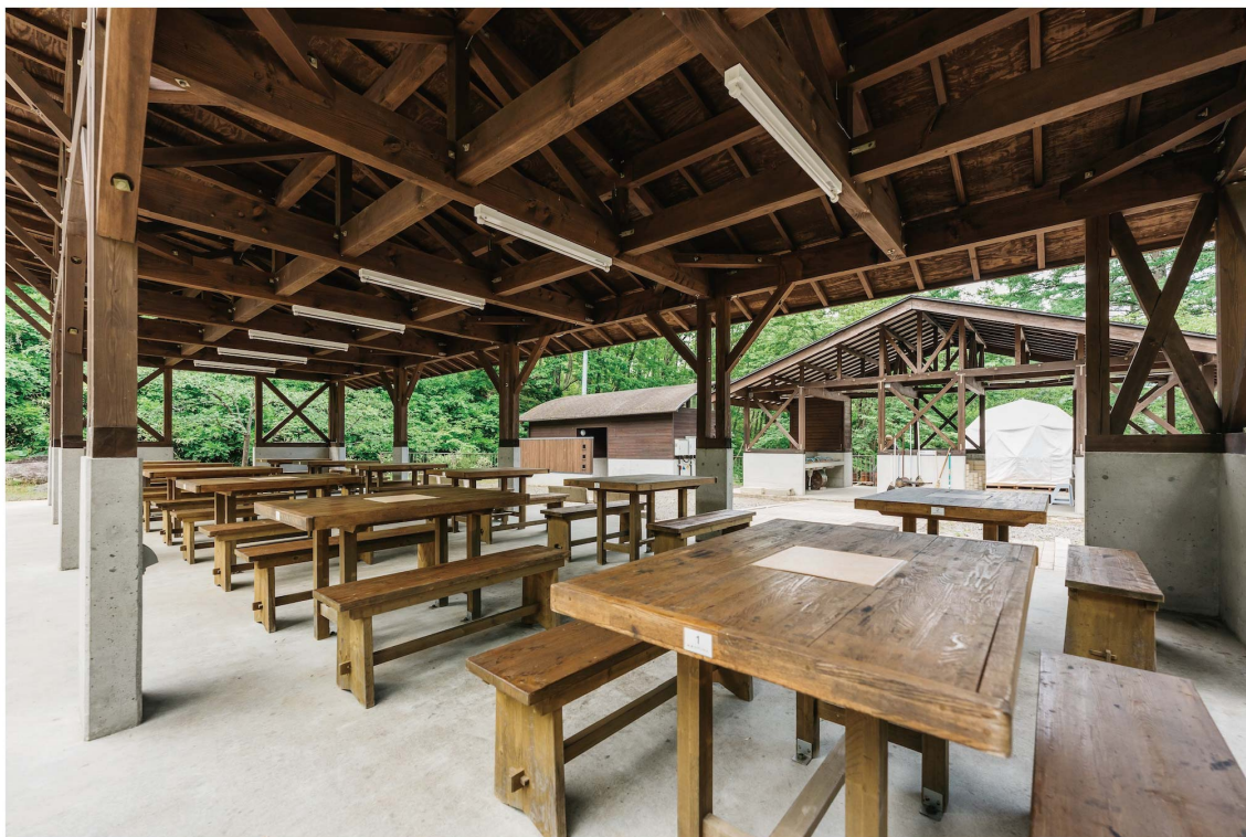
■ 食事棟テーブル外観（イメージ）